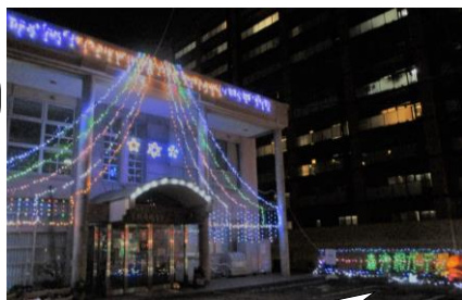
「森津根ガーデン」できらきら☆

令和4年12月10日17時、イルミネーション点灯式がありました。今年も、守恒校区を明るく照らしてくれました~★★★