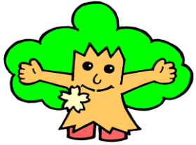
守恒校区キャラクター もねっとくん