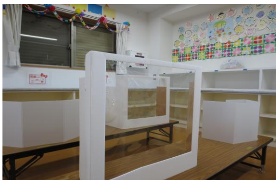
学童では机にパーテーションを設置しています。